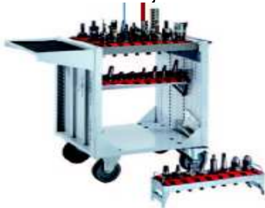
Vogner for verktøy