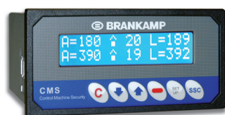
Huvudenhet med skärm och minne

Skydda din maskin, sänk dina kostnader och minska stilleståndet. En maskinkollision kan kosta väldigt mycket i tid och pengar. Nu kan du sänka dessa kostnader kraftigt eller undvika dem helt och hållet med hjälp av ett "Control Machine Security (CMS)" system från Brankamp.